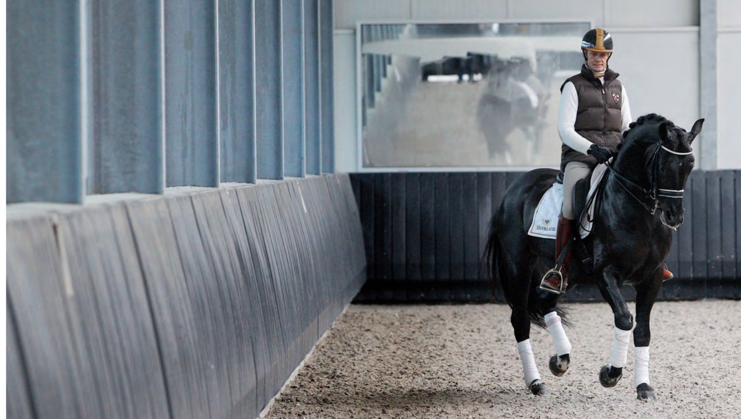
Resim Dressage in Harskamp liet een Safety Wall van Q-Line aanleggen zodat Edward Gal zijn paradepaard Totilas veilig kon trainen.

schakel en dat mag nooit het paard of de mens zijn."